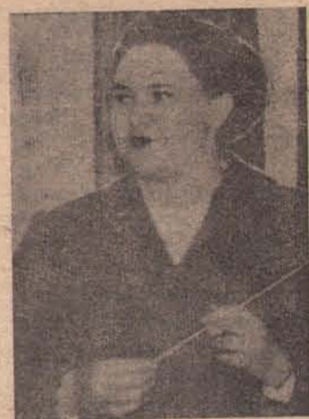
Учитель на селе призван вести повседневную общественную работу. Нести в население все новое — это большая ответственность и честь.