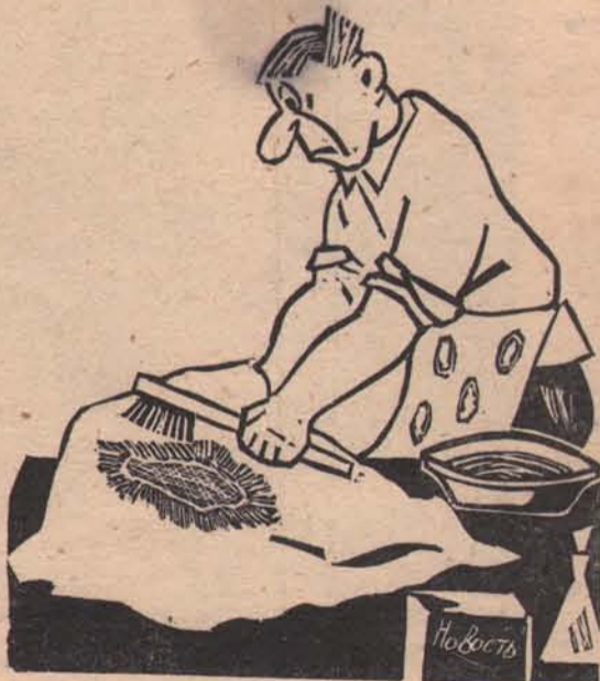
Несмотря на все старания, чернильное пятно не поддавалось...