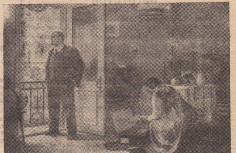
«Перед отъездом в Россию». Картина худ. И. Беляковой.

9 января стачка стала всеобщей. В воскресенье 9 января рабочие с семьями (всего более 140 тысяч) направились к Зимнему дворцу с петицией к царю. По приказу царского правительства войска открыли по безоружным людям огонь. Было убито более 1000 человек и ранено около 5 тысяч. Это кровавое злодеяние всколыхнуло массы. Повсюду начались демонстрации, стачки. Рабочие взяли за оружие. На улицах были воздвигнуты баррикады.