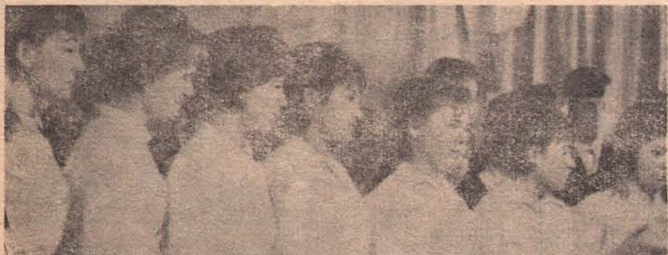
Комсомольцы — первые помощники партии, ее резерв.