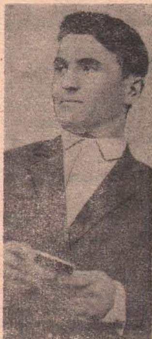
Клянусь на верность партии!