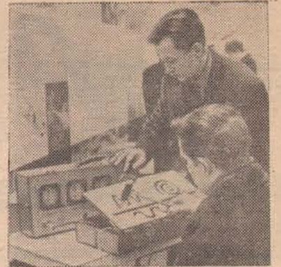
МОСКВА. В Свердловском институте охраны труда ВЦСПС разработан прибор для проверки точности движений и степени утомляемости рабочих на предприятиях часовой, приборостроительной, радиоэлектронной и других отраслей промышленности — анализатор двигательных координатных реакций «АДКР-1». Испытуемый должен взять в руки небольшой металлический шуп и провести им по цели выреза из конца в конец, не касаясь краев, за возможно более короткий промежуток времени. Секундомеры и счетчики касаний на контрольном блоке прибора фиксируют время и ошибки при выполнении этой операции. НА СНИМКЕ: посетители павильона «Машиностроение» на ВДНХ СССР знакомятся с работой аппарата «АДКР-1».

Скоро начнется весенний сев. В оставшиеся дни надо хорошо подготовить технику, довести до нужных кондиций семена, ускорить заготовку органических и минеральных удобрений, составить рабочие планы на каждое поле севооборота, разработать условия социалистического соревнования.