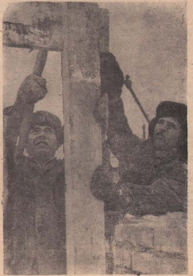
Как и в обычный рабочий день строители РСУ приступили к делу в восемь утра. Продолжали делать начатое накануне крепление устройство для здания комбината бытового обслуживания.

На высоте были мужчины. Они огородили свиноферму, а потом выехали во вторую бригаду — в с. Ангыр и на сво-