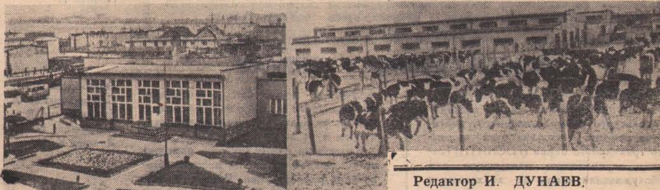
Редактор И. ДУНАЕВ.