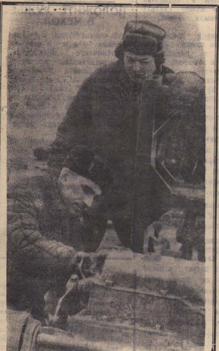
Успехи лесозаготовительного участка Кика в нынешнем году во многом зависят от работы ремонтников. Им обязаны водители лесовозов и трелевочных тракторов за бесперебойность службы техники.