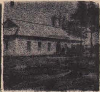
Село Ильинка. Центральная усадьба колхоза „Заветы Ильича“. Помещение правления колхоза.