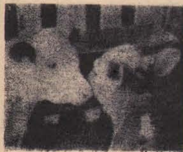
Эти полята — будущее сельхозартели. Через 2-3 года они превратятся в коров, радующих животноводов трехтысячнелограммовыми годовыми удоями.