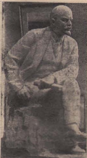
Образ вождя революции—Владимира Ильича Ленина—неиссякаемая тема в искусстве.

За годы Советской власти в нашей стране и за рубежом создано много художественных произведений, посвященных Владимиру Ильичу Ленину. Значительное место среди них занимает скульптура. Еще при жизни Владимира Ильича были созданы его скульптурные портреты Г.Д. Алексеевым, Н.И. Альтманом, Н.А. Андреевым.