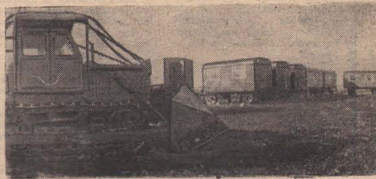
ПСКОВ. Интересную новинку показали участникам семинара мелиораторов псковичи. Это полевой стан тракторной мелиоративной бригады. Он состоит из передвижных вагончиков, в которых размещаются электростанция, механическая мастерская, контора, жилые помещения, клуб, кухня, столовая. Такие станы выпускает Псковское объединенное промышленное предприятие областного управления мелиорации и водного хозяйства.