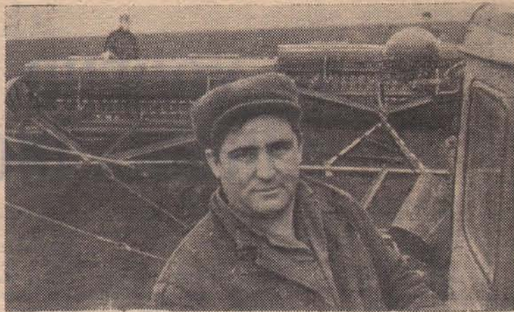
ДОНЕЦКАЯ ОБЛАСТЬ. Механизаторы колхоза имени Калинина Володарского района закончили подкормку озимых посевов, хорошо подготовили почву под яровые и начали сев ранних зерновых.