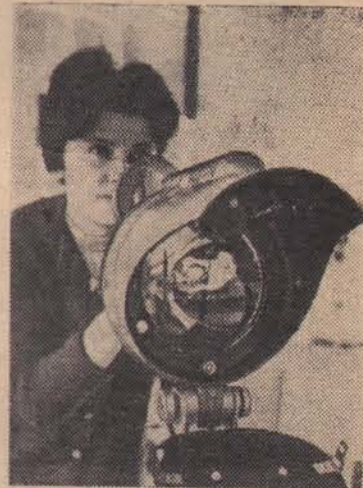
Туманная дымка, пыльная пелена ограничивают, особенно в ночное время, пределы видимости. Вот почему большой интерес в павильоне «Гидрометслужба» ВДНХ СССР вызывает новый прибор для определения дальности видимости в темноте — нефелометрическая установка «М-71», изготовляемая Ленинградским объединением.