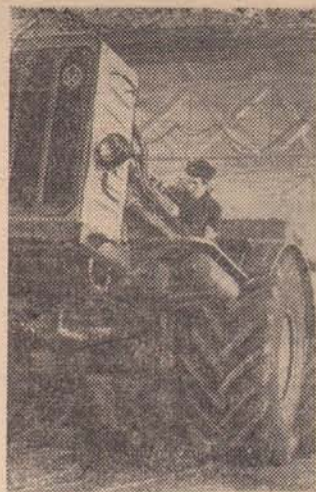
КУРГАНСКАЯ ОБЛАСТЬ. Завершить в этом году пятилетний план продажи зерна государству — такой рубеж наметили труженики села Зауралья, принимая обязательства к 100-летию со дня рождения В. И. Ленина.

По завершению смотра общезаводская смотровая комиссия сдает все свои материалы главному экономисту предприятия или, по указанию директора, другому должностному лицу. Главный экономист предприятия обязан добиваться исполнения принятых предложений, включения их в оргтехпланы, издания соответствующих приказов по предприятию, заводу. Он должен также обеспечить учет реализации принятых предложений в процессе смотра и их экономической эффективности, а также составление календарного плана и графика внедрения мероприятий по совершенствованию организации труда и нормирования.