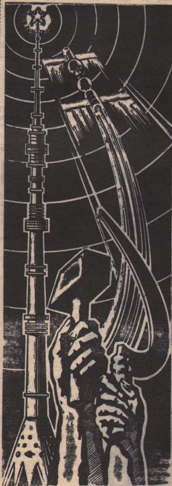
Плакат художника С. Гринько.