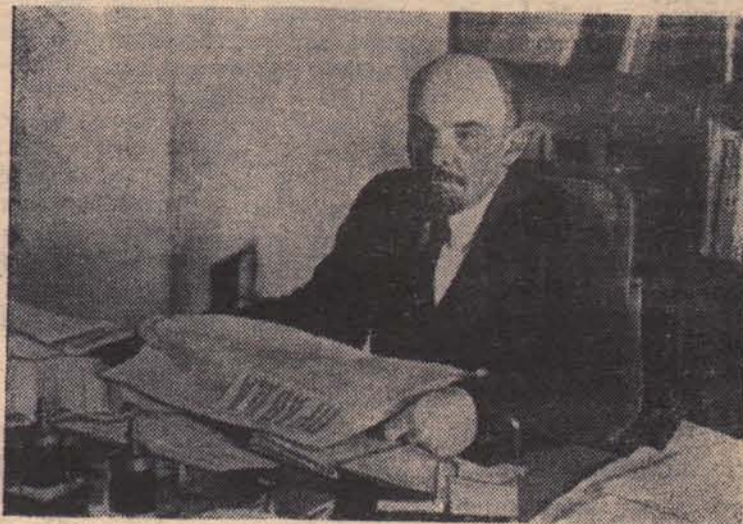
В. И. Ленин в Кремле. 1918 год.

Фоторепортаж с праздничной демонстрации жителей районного центра напечатан на второй странице.