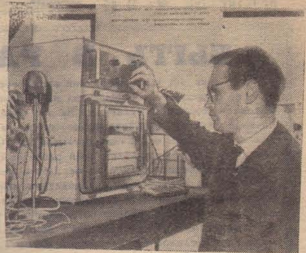
МОСКВА. Международная выставка «Автоматизация-69».

М Ы ПРИЗЫВАЕМ всех работников животноводства района приложить все силы для выполнения принятых социалистических обязательств по достойной встрече 100-летия со дня рождения В. И. Ленина.