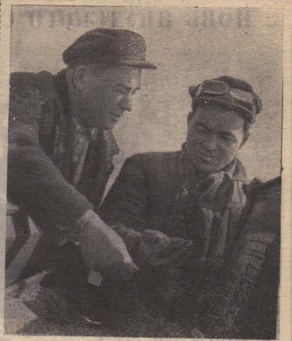
Пять миллионов гектаров отвели под зерновые трудяги поля Алтая. Это на триста тысяч больше прошлогоднего.