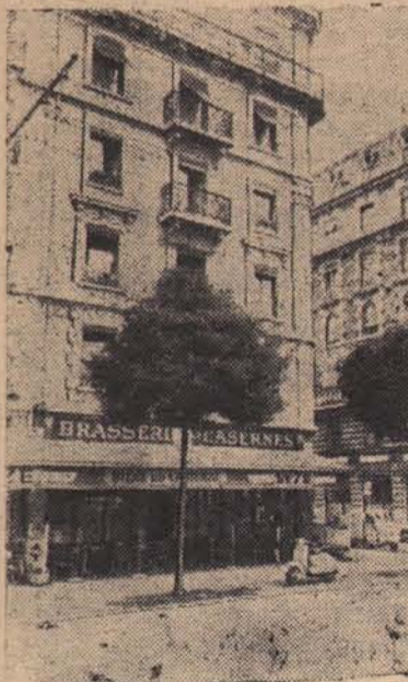
На снимке: Женева. Улица Дюбуа-Мелли, 6. В начале XX века в кафе «Казерн» находился Народный дом, где собирались политэмигранты. Здесь неоднократно выступал В. И. Ленин.

В период войны были исключительно велики трудности ведения революционной работы. Ленин был отрезан от России многочисленными фронтами. Письма, газеты, журналы приходили из России нерегулярно, с большим опозданием. В это время царская полиция особенно яростно громила большевистские организации в