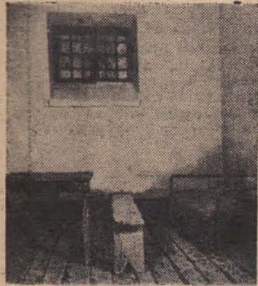
На снимке: Новый Тарг. Камера № 7 в здании бывшей тюрьмы. Здесь находился в заключении В. И. Ленин, арестованный австрийскими властями (август 1914 г.).

Летом 1914 года началась первая мировая война, в которой противоборствовали две группы империалистических государств: Германия и Австро-Венгрия — с одной стороны, Англия, Франция, Россия — с другой. Потом в нее вступили и другие ка-