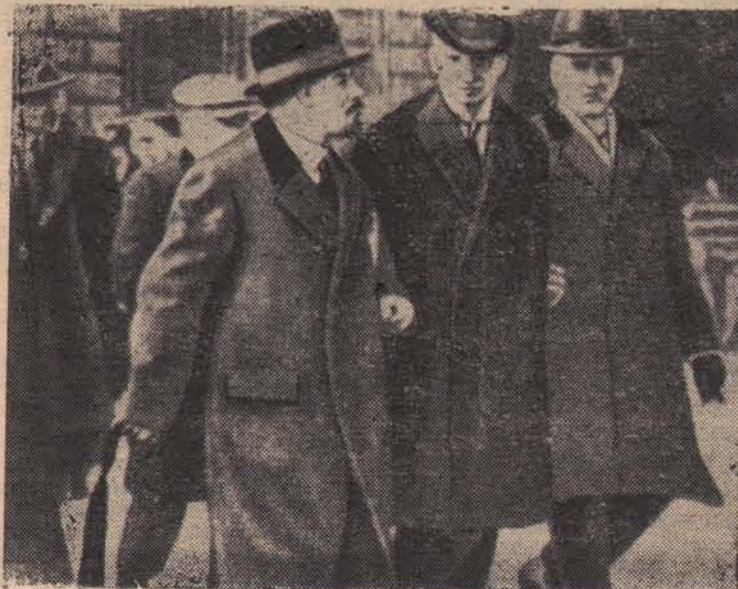
На снимке: В. И. Ленин в Стокгольме проездом при возвращении из Швейцарии в Россию. Апрель 1917 года.

Весть о победе восстания в Петрограде дошла до Ленина в начале марта. В своих «Письмах издалека» он подробно анализирует революционные события в России и обосновывает большевистскую тактику. Революцию, свергнувшую царизм, Ленин рассматривает лишь как первый этап революции, которая должна перерасти в социалистическую. В начале апреля 1917 года Ленин приехал в Петроград.