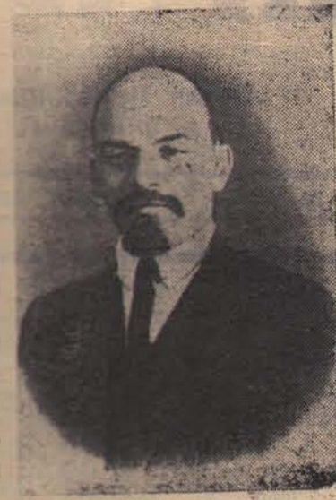
На снимках: дом по улице Шпигельгассе в Цюрихе (Швейцария). Здесь с 21 февраля 1916 года до отъезда в Россию жил В. И. Ленин и Н. К. Крупная. В. И. Ленин. Цюрих (Швейцария), 1917 год.