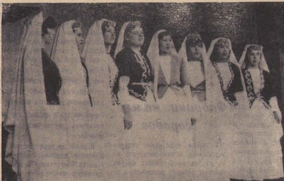
Цветущую республику — Армению — представляет на фестивале коллектив Селенгинской ЛПБ. Девушки в национальных костюмах исполняют старинную армянскую песню.