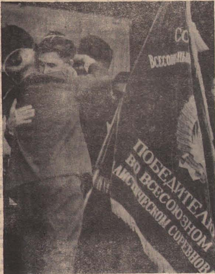
ЗНАМЯ — ПРИБАЙКАЛЮ! Репортаж с праздника «Слава Труд!» читайте на 2 странице.

ЛЕНИНУ, ПАРТИИ, РОДИНЕ — НАШИ СЕРДЦА И ТРУД!