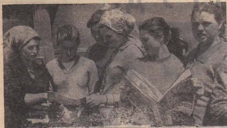
МОЛДАВСКАЯ ССР. 850 жителей села Скуляны Унгенского района являются активными читателями сельской библиотеки. Часто ее работники доставляют литературу на полевые станы и фермы.