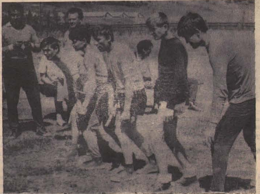
В напряженном ожидании застыли на старте участники эстафеты. Команда «Марш» и секундомеры начнут отсчитывать секунды борьбы за кубок.

Два дня спортсмены оспаривали звание сильнейших по шести видам спорта. Наибольший интерес у зрителей вызвали соревнования по волейболу, футболу и эстафета на приз газеты «Прибайкалец». Десять коллективов выставили футбольные команды. Интересную игру показали футболисты колхоза «Прибайкалец». В полуфинале жребий свел их с командой райцентра. И хотя колхозные футболисты проиграли со счетом 2:1, симпатии многих болельщиков были