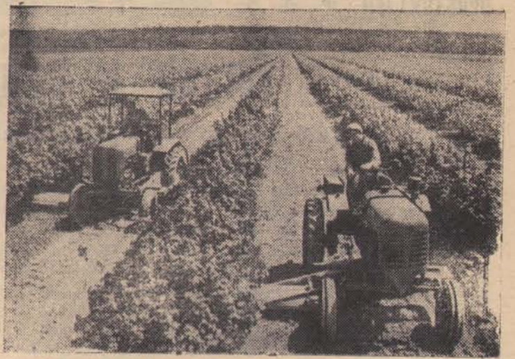
ХАБАРОВСКИЙ КРАЙ. Садоводство становится одной из ведущих отраслей сельского хозяйства на Дальнем Востоке. Граница садов постепенно поднимается на Север, местные селекционеры выводят морозоустойчивые, скороспелые сорта

НА СНИМКЕ: обработка смородинового сада в Вяземском плодово-ягодном совхозе.