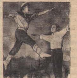
ФРУНЗЕ. В павильоне киностудии «Киргизфильм» снимается цветной фильм «Поющая пиала».

В сельском хозяйстве Кубы увеличивается применение сельскохозяйственных машин на посадке, культивации и уборке урожая различных культур. В стране в последние годы широко стали применяться погрузочные машины для сахарного тростника, построенные в Советском Союзе. В прошлом эта работа выполнялась только вручную. Каждая машина заменяет теперь труд пятидесяти человек. Механизация используется на копке ямок при посадках кофейных и цитрусовых деревьев. НА СНИМКЕ: советский трактор «Владимирец» обрабатывает плантации ананасов.