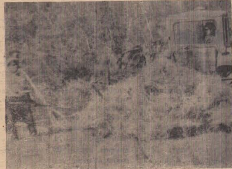
Не всегда технике посильно то, что и людям. Нездолго траву нынешнего года не всегда соберешь тракторной волокушей, даже если сено и собрано в копны. И на помощь машине приходят люди. Так и в Нестеровской бригаде колхоза «Путь к коммунизму» часть сена (на снимке) укладывается на волокушу простыми вилами.

Ударный декадник закончился. Ударная работа на лугах должна быть продолжена.