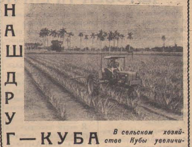
НАШ ДРУГ — КУБА

Поэтому, исходя из биологии кедр, срок заготовки орехов установлен только с 1 сентября. Но, к великому сожалению, приходится видеть в эти дни в населенных пунктах района — в Турунтаево, Коле, Татаурово, — как многие подростки шелушат очищенные от чешуи, незрелые кедровые орехи. Некоторые «любители природы» уже побывали в кедровниках, не давая себе ясного отчета в том, какой непоправимый вред они наносят этому ценному дереву. Это явные браконьеры, которых надо задерживать и наказывать, привлекая к самой строгой ответственности. Одной лесной ох-