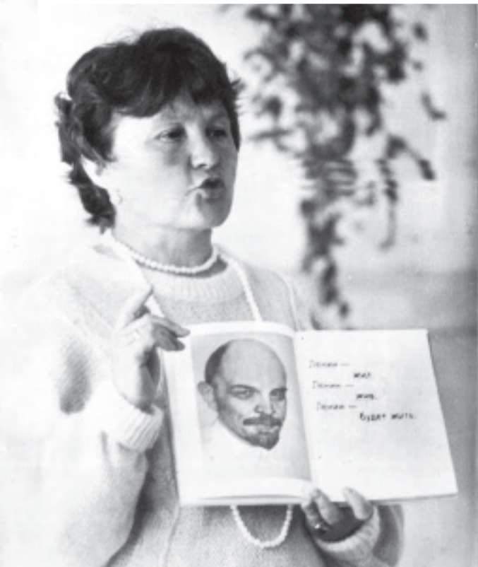
На снимке: на утреннике в детском саду.

В недавнем нашем прошлом каждый гражданин Советского Союза, начиная с детского возраста, был знаком с формулой: «Ленин жив, Ленин будет жить» - и по ней должен был сверять свою жизнь и поступки. Книжки о разных периодах жизни Владимира Ильича, начиная с возраста, «когда был Ленин маленький, с кудрявой головой», и до многоотомного собрания сочинений выходили миллионными тиражами, были на полках даже самых маленьких библиотек, в том числе и на бортах судов, полярных станциях.