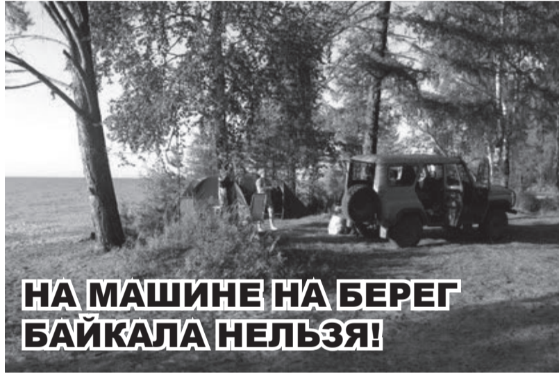
Новая статья Кодекса об административных правонарушениях запрещает нахождение любого вида транспорта в водоохранной зоне. Можно «заработать» штраф в сумме 4500 руб.