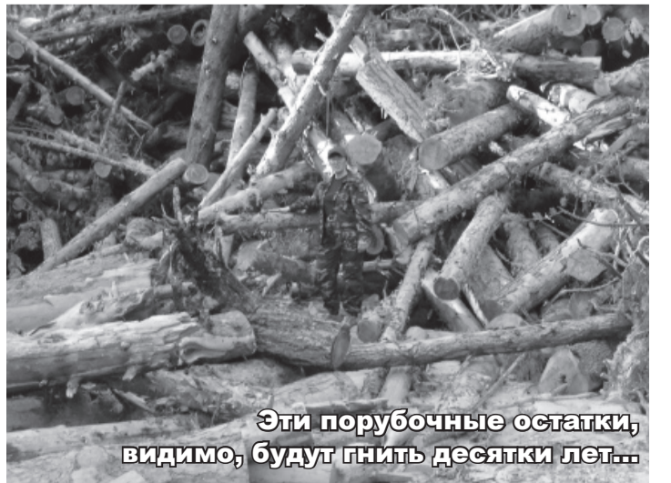
Эти порубочные остатки, видимо, будут гнить десятки лет...