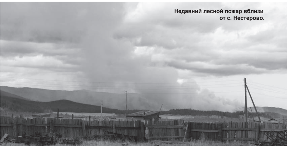
Недавний лесной пожар вблизи от с. Нестерова.