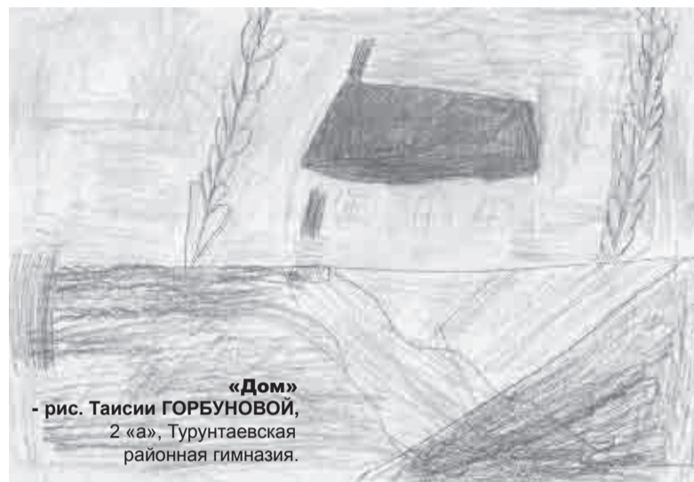
«Дом» - рис. Таисии ГОРБУНОВОЙ, 2 «а», Турунтаевская районная гимназия.