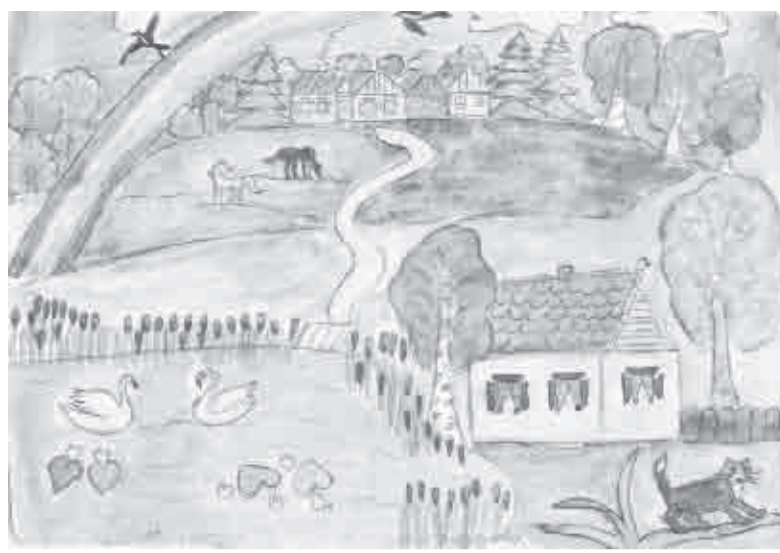
«Моя улица» - рис. Оксаны БИРЮКОВОЙ, 4 класс, Гремячинская школа.