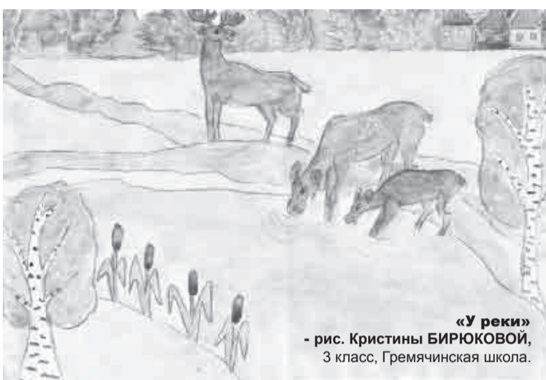
«У реки» - рис. Кристины БИРЮКОВОЙ, 3 класс, Гремячинская школа.