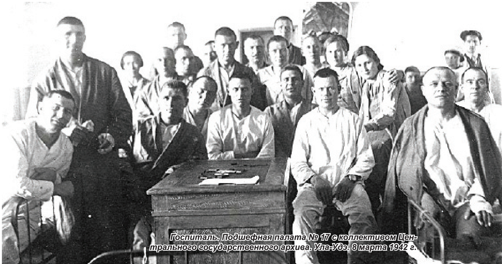
Госпиталь. Подшефная палата № 17 с коллективом Центрального государственного архива. Улан-Удэ. 8 марта 1942 г.