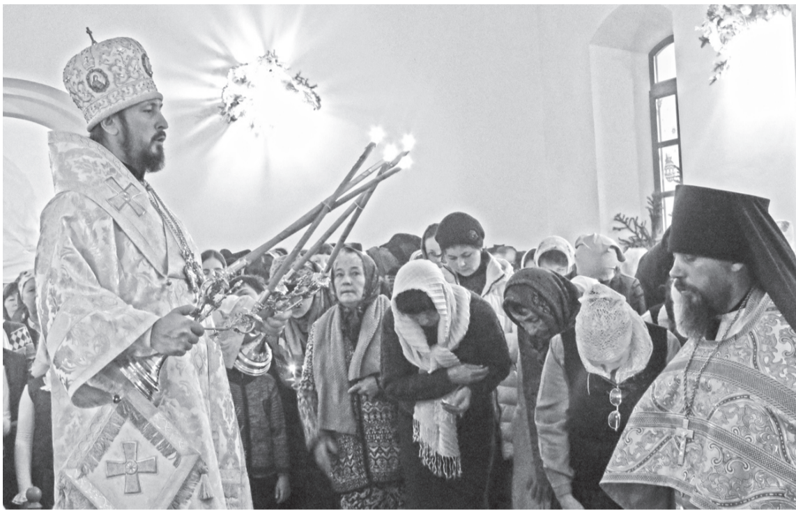
Рождественская служба архиепископа Савватия в Троицко-Селенгинском монастыре.

пастырям, монашествующим и всем верным чадам Улан-Удэнской и Бурятской епархии Русской Православной Церкви