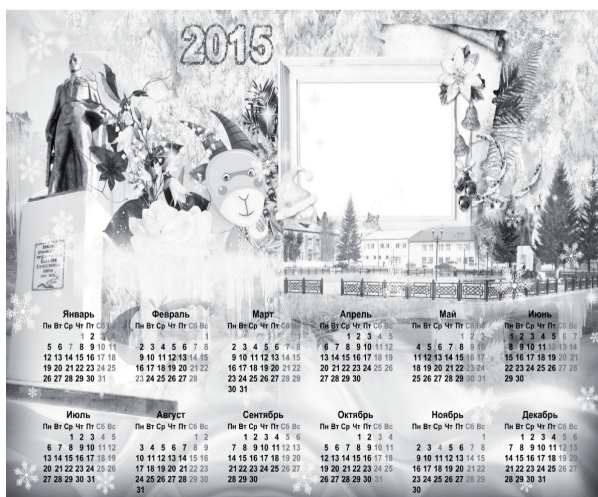
На таком календаре может быть ваше фото!

ВПЕРЕДИ ЕЩЁ МНОГО ПРАЗДНИКОВ, А ЗНАЧИТ ПОВОДОВ ДЛЯ ПОДАРОКОВ И СУВЕНИРОВ. Редакция «Прибайкальца» может помочь сделать праздничный презент для родных и близких вам людей. Календарь, буклет, блокнот, книжка и другая полиграфическая продукция с вашими фото-материалами.