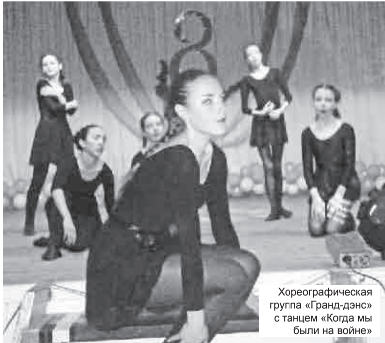
Хореографическая группа «Гранд-дэнс» с танцем «Когда мы были на войне»

Как известно, весна нам дарит любимый женский праздник «8 Марта». В этот день женщины всей страны получают цветы, поздравления и подарки. Вот и у нас, в Таловском культурно-информационном центре, подарками для женщин были следующие мероприятия: вечер отдыха «Весна и женщина похожи», концерт «Дарите женщинам цветы», молодежные дискотеки. На вечер отдыха наши гости не только с удовольствием смотрели концертные номера, но и сами активно участвовали в разнообразных музыкальных и шуточных конкурсах, танцевали, отгадывали загадки, в общем, отдохнули, получили заряд бодрости и хорошего настроения.