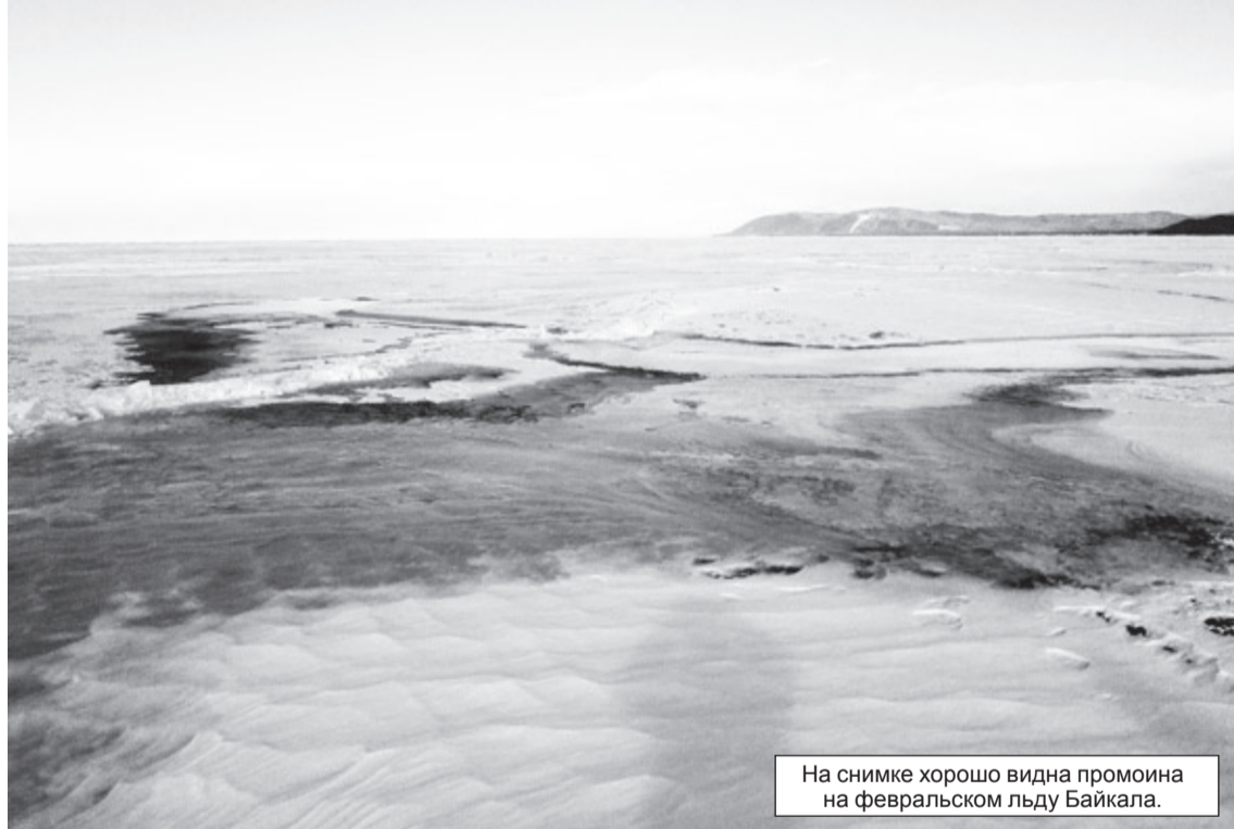
На снимке хорошо видна промоина на февральском льду Байкала.

В этом году в связи с тёплой зимой лёд на озере Байкал тоньше обычных показателей. В Кабанском районе озеро отдельными участками схватилось, а кое-где льда нет, поэтому постоянно происходят подвижки, разрывы и ломка льда.