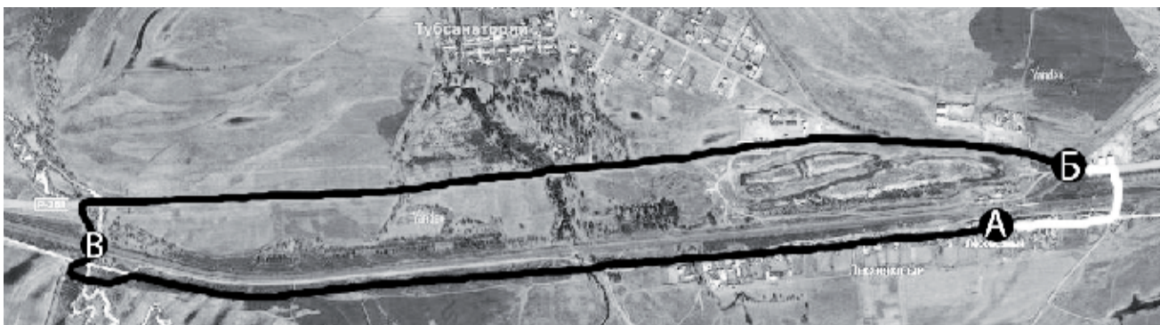
На плане, "А" - станция «Лесовозный», "Б" - развилка напротив закрытого переезда, "В" - железнодорожный мост. Чёрная линия - траектория движения сегодня, белая - если бы работал переезд.

Пешком от улицы Братьев Валуевич до центра Ильинки около полутора километров. На машине, чтобы попасть туда же, придётся проехать около семи