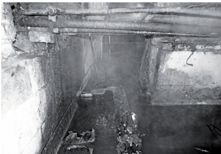
Это не декорации фильма ужасов, а подвал Старотатауровской пятиэтажки.

Сфера ЖКХ - это огромный и плохо контролируемый бизнес. В 2006 году в России был принят новый Гражданский кодекс, который кардинально поменял систему управления жилыми домами. До этого они управлялись муниципальными структурами. Но с 2006 года собственники жилья получили возможность и даже обязанность самостоятельно решать, как им управлять своим имуществом. Законодательством предоставлены две формы управления: либо жильцы объединяются и создают ТСЖ, либо заключают договор с управляющей компанией, и уже она управляет их домом.