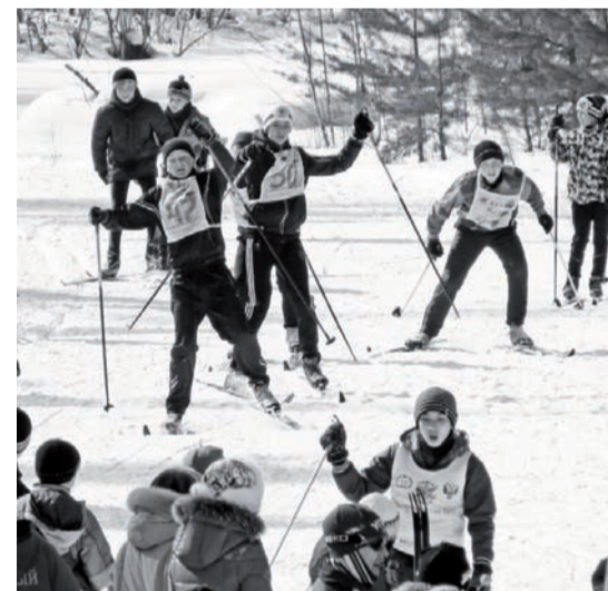
У финишной черты.