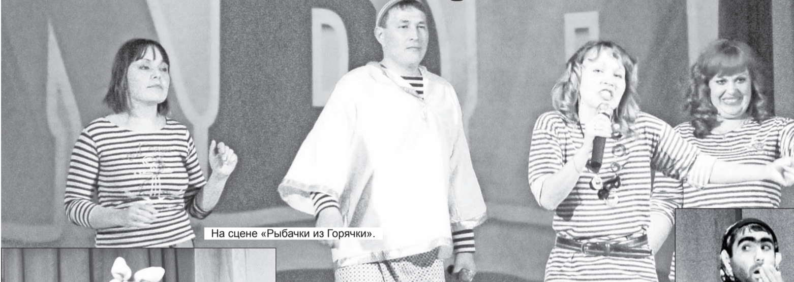
На сцене «Рыбачки из Горячки».