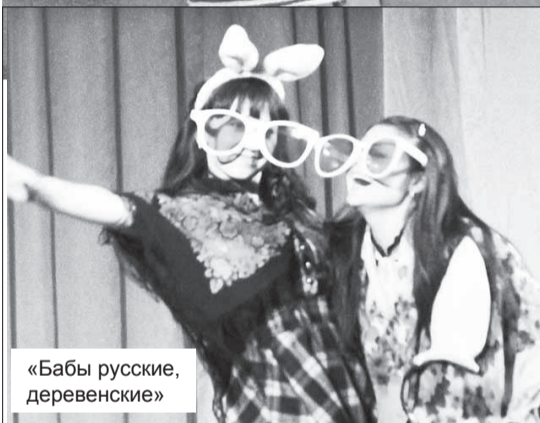
«Бабы русские, деревенские»