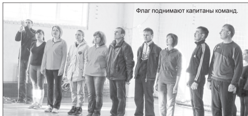
Флаг поднимают капитаны команд.

Наступила долгожданная весна и работники образования встретились на традиционной спартакиаде, в которой участвовало 113 спортсменов из 12 команд, представляющих 15 образовательных учреждений района. Такое количество команд свидетельствует о высоком уровне подготовки и организованном проведении спартакиады прошлых лет.