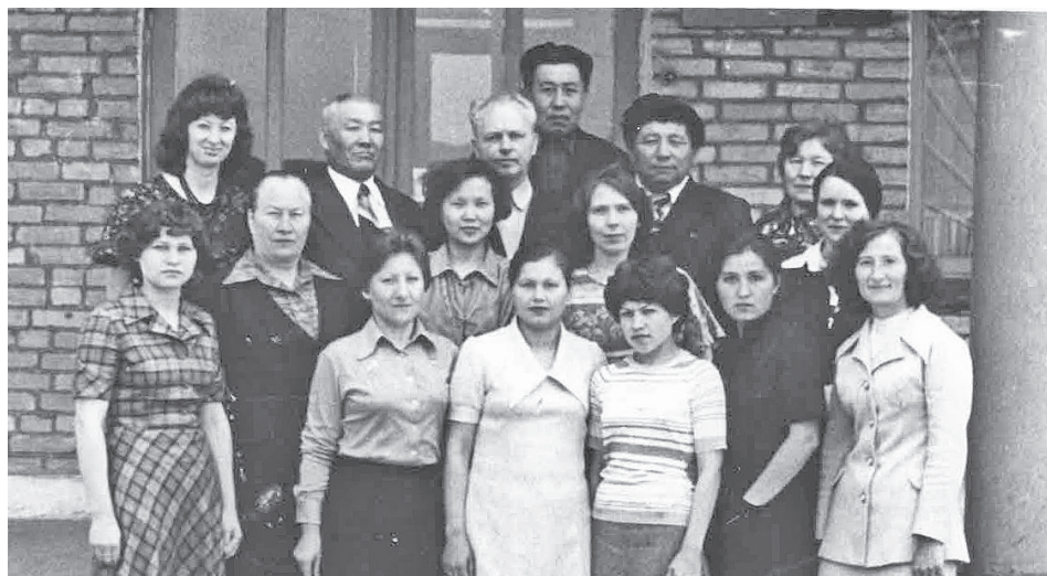
Коллектив госбанка в 70-х годах.

ОТ РЕДАКЦИИ: Уважаемые прибайкальцы! Многие из вас – живые свидетели исторической летописи района. Мы приглашаем вас поделиться своими воспоминаниями на страницах нашей газеты. Не оставайтесь в стороне – каждое ваше слово важно и нужно молодому поколению. Пишите нам. Приходите в редакцию. Рубрика «К юбилею района. Летопись» ждёт ваших рассказов.