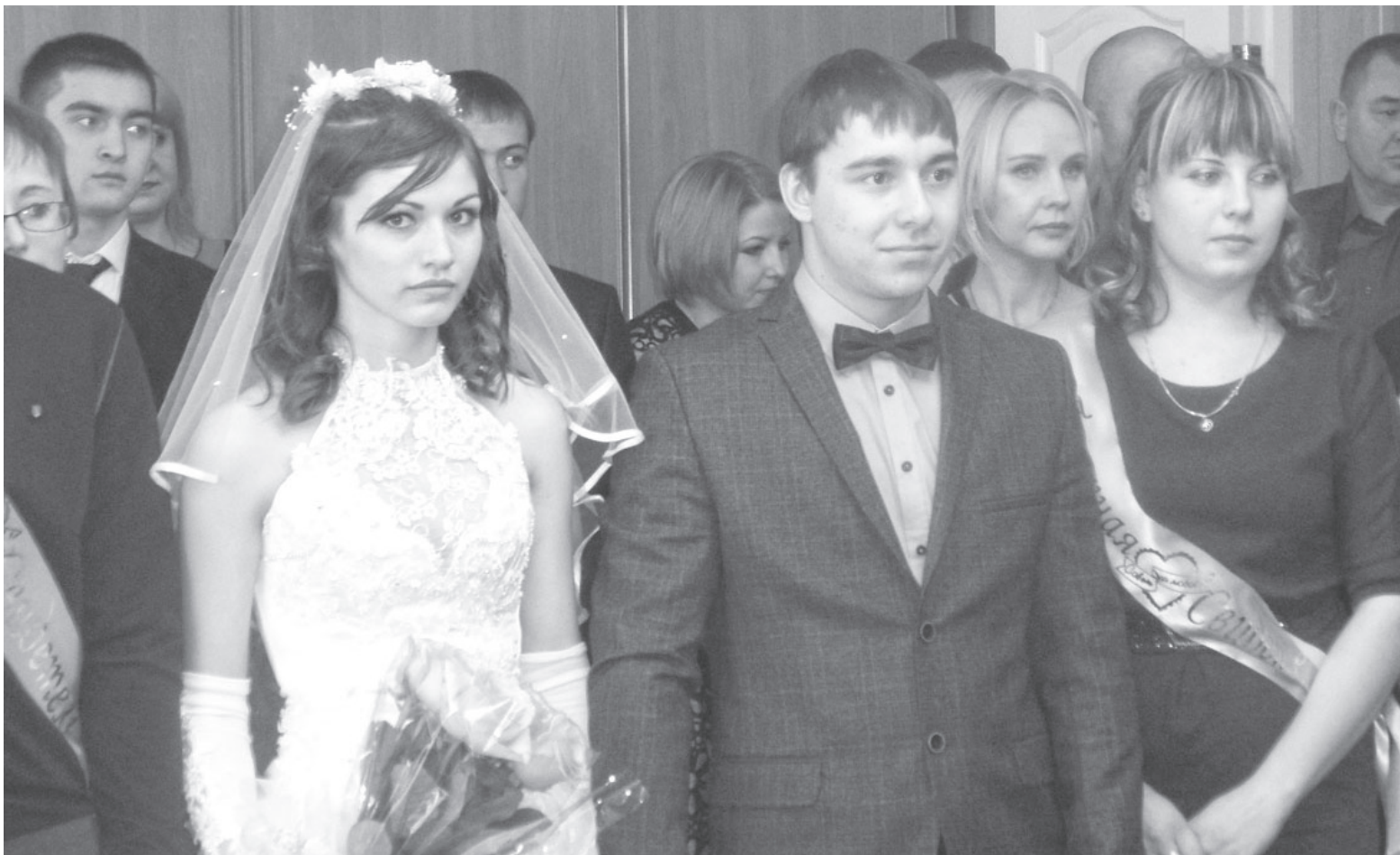
Первое семейное фото Никифоровых.

Наступил 2015 год. Год 70-летия Победы советского народа в Великой Отечественной войне и юбилея нашей малой родины. Прибайкальскому району 12 декабря 2015 года исполняется 75 лет.