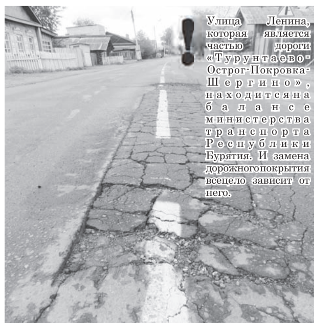
Улица Ленина, которая является частью дороги «Турунтаево-Острого-Покровка-Шергино», находится на балансе министерства транспорта Республики Бурятия. И замена дорожного покрытия всецело зависит от него.