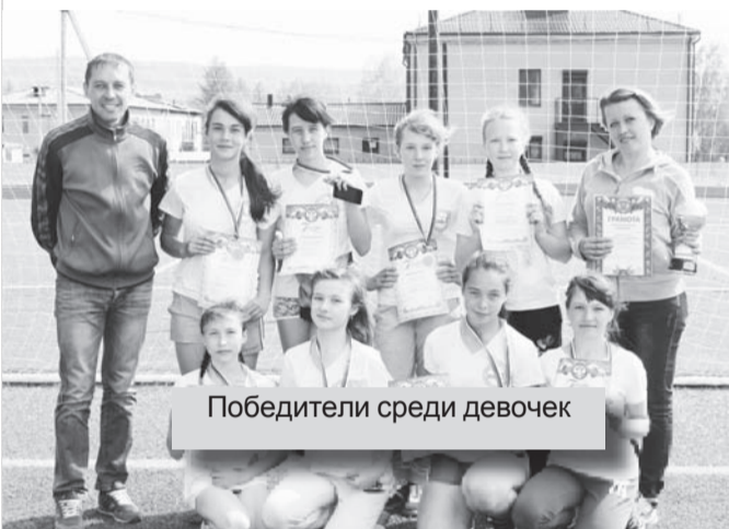
Победители среди девочек

Комитет по физической культуре, спорту и молодёжной политике уже на протяжении семи последних лет ежегодно проводит районные соревнования по футболу «Кожаный мяч» среди общеобразовательных школ района. В этом году соревнования прошли среди мальчиков 2002 г.р. и младше и среди девочек 2001 г.р. и младше по мини – футболу.