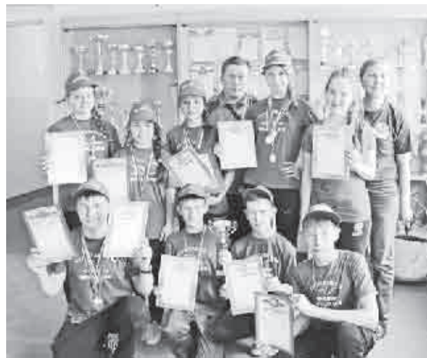
Победители «Президентских состязаний» в августе поедут в Анапу