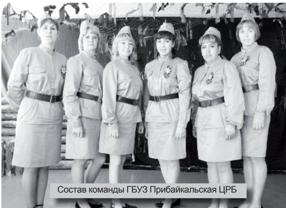
Состав команды ГБУЗ Прибайкальская ЦРБ

под таким названием 14 мая стартовал IV республиканский конкурс среди работников медицинских организаций Бурятии.