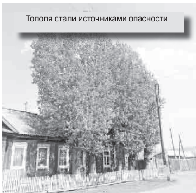
Тополя стали источниками опасности

Тополя с вросшим в ветви опасным проводом как стояли, так и стоят