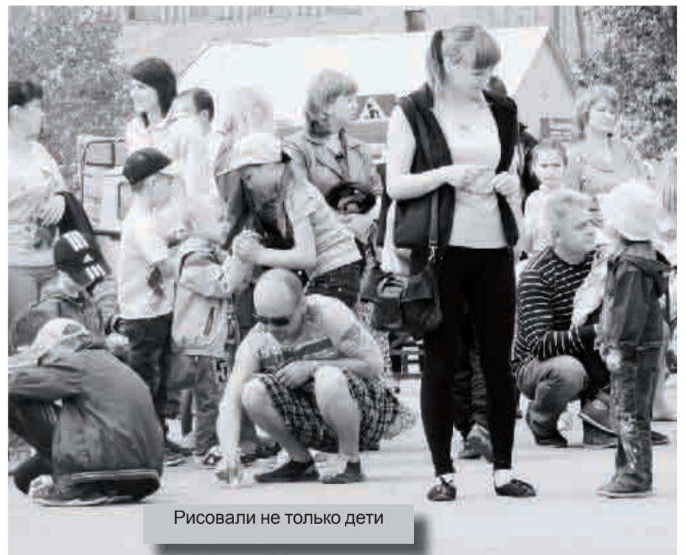
Рисовали не только дети

В первый день лета на площади райцентра прошёл большой праздник, посвященный Дню защиты детей. Организаторы подготовили для детей массу развлечений, каждому ребёнку удалось найти занятие по душе.