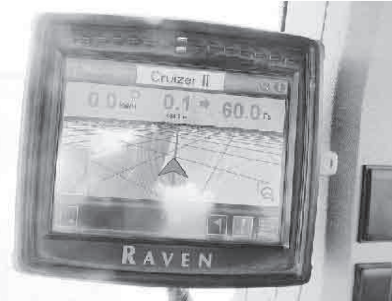
НАВИГАТОР RAVEN CRUIZER II для параллельного и контурного вождения сельхозтехники

Работники ООО «Гарантия-2» на погрузке картофеля