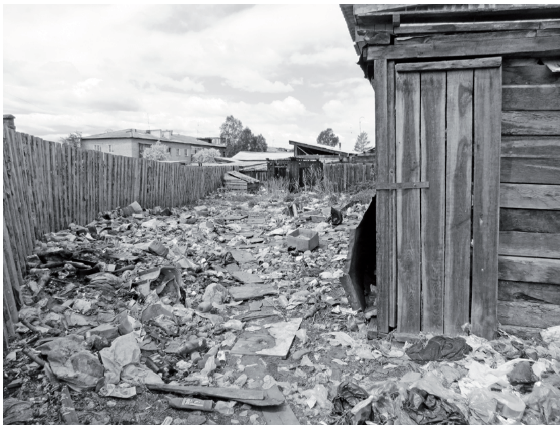
Мусор не вывозится, поэтому избавляются от него, кто как может

Гагарина расположен другой жилой дом - полная противоположность этому, где чисто, и есть мусорные баки. И пройти мимо дома приятно.