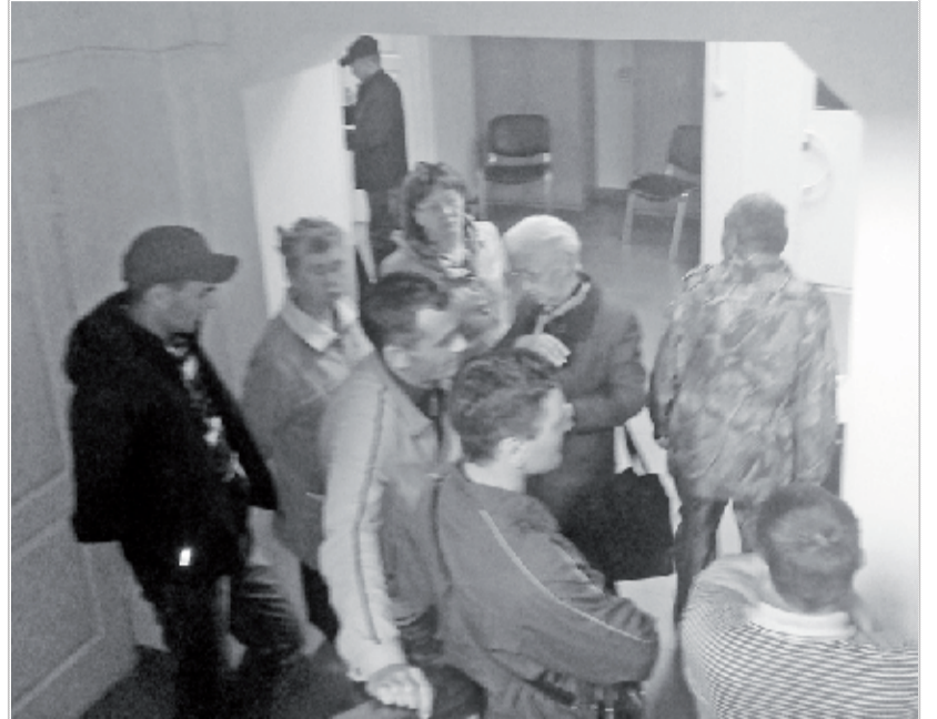
Очереди в банке почти каждый день!

Неоднократно в редакцию газеты обращались жители района с претензиями к «Россельхозбанку».