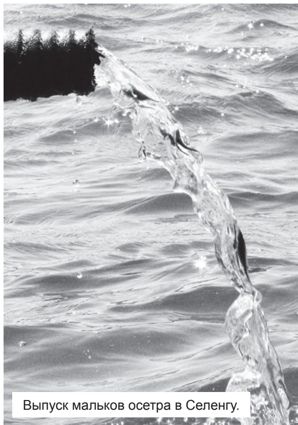
Выпуск мальков осетра в Селенгу.