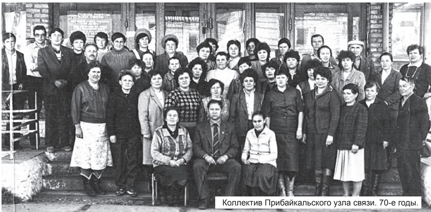
Коллектив Прибайкальского узла связи. 70-е годы.