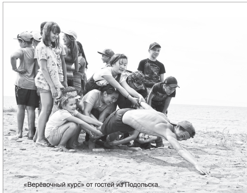
«Верёвочный курс» от гостей из Подольска.