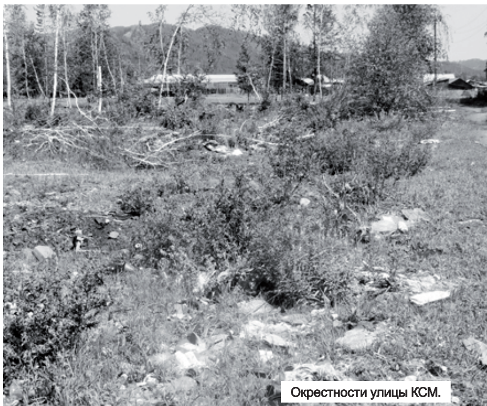
Окрестности улицы КСМ.

Редакции приходится выслушивать не одно обращение от населения за день. Так, к нам пришла женщина, которая сетовала на мусор, скопившийся в лесочке между улицами КСМ и Полевая.