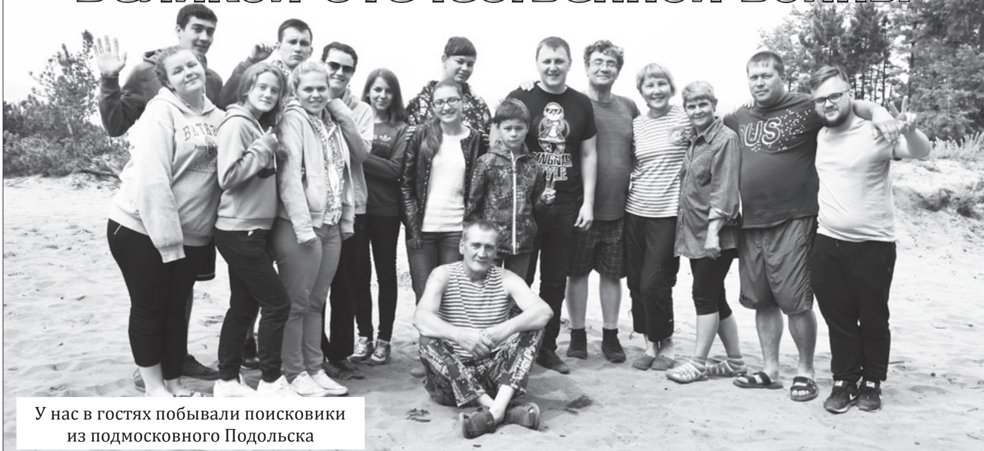
У нас в гостях побывали поисковики из подмосковного Подольска

«Любовь к Родине – первое достоинство цивилизованного человека». Эти слова одного из великих полководцев могут быть лозунгом делегации из двенадцати молодых, энергичных и активных представителей подмосковного Подольска. В их числе руководители молодежных объединений, члены поисковых отрядов, журналисты.