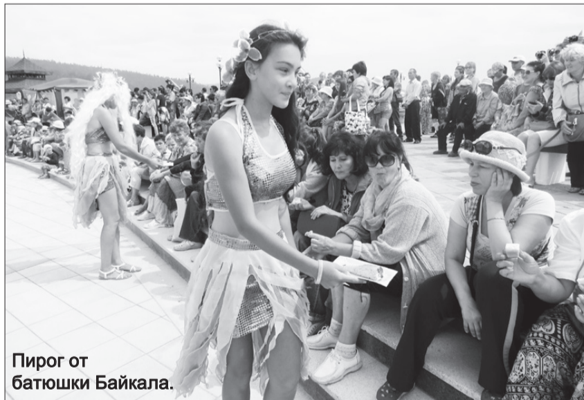
Пирог от батюшки Байкала.

Начало семинара в 11.00 ч. Регистрация участников с 10.30 ч. Телефон для справок: 8(30144)51-2-88.