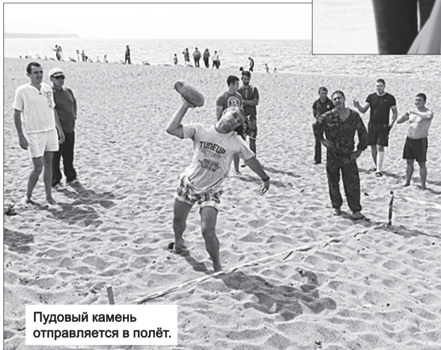
Пудовый камень отправляется в полёт.