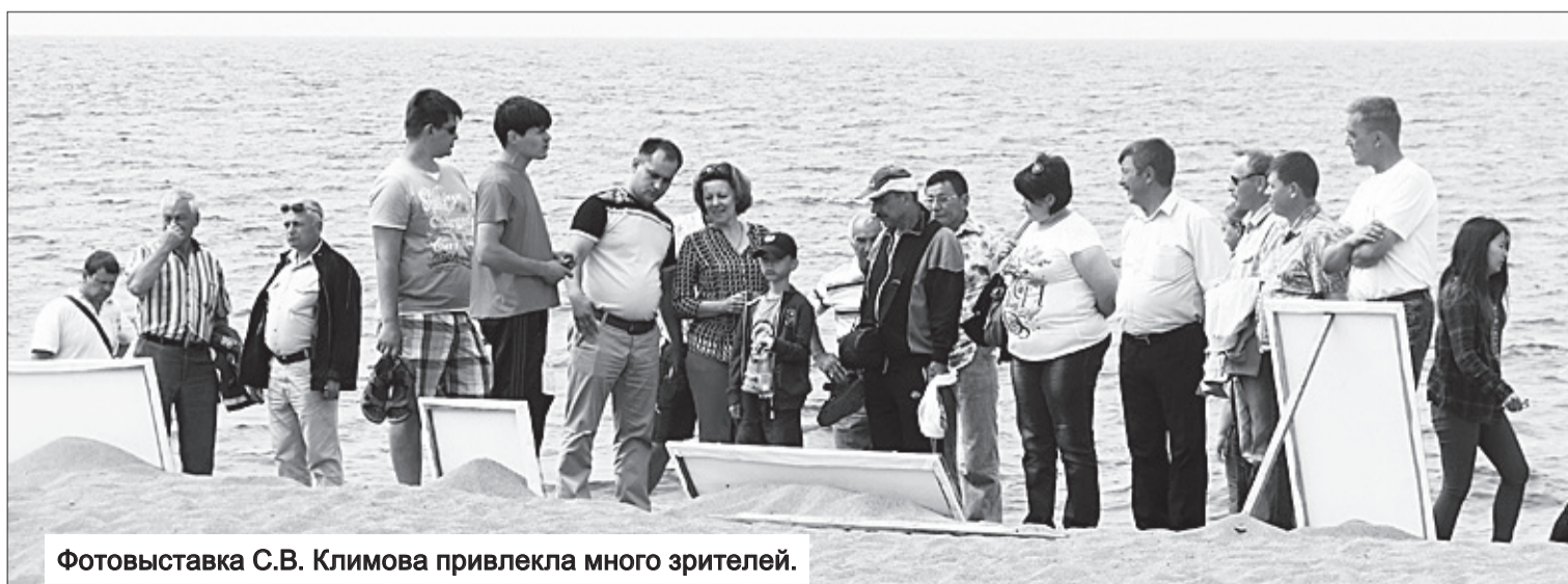
Фотовыставка С.В. Климова привлекла много зрителей.