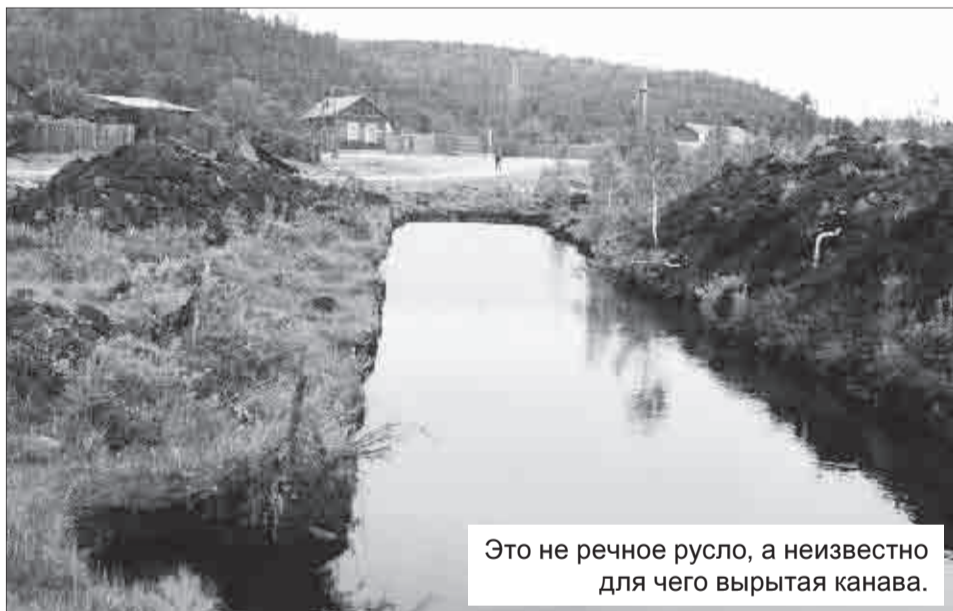
Это не речное русло, а неизвестно для чего вырытая канава.