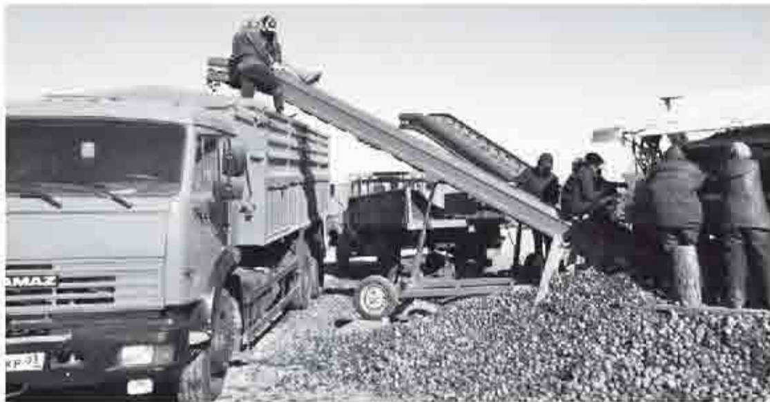
Тяжелая засуха поставила под удар урожай местных сельхозпроизводителей

Потребность в финансовых средствах на закуп кормов в Бурятии составляет 1,9 млрд руб. В связи с этим на организацию закупок кор-