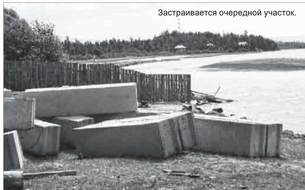
Застраивается очередной участок.