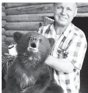
Фото со спасённым на охоте медвежонком.

Умер хороший человек. Трудно найти того, кто бы не подписался под этими словами. Добрый, с открытой душой. Он всегда шутил — весело, беззлобно.