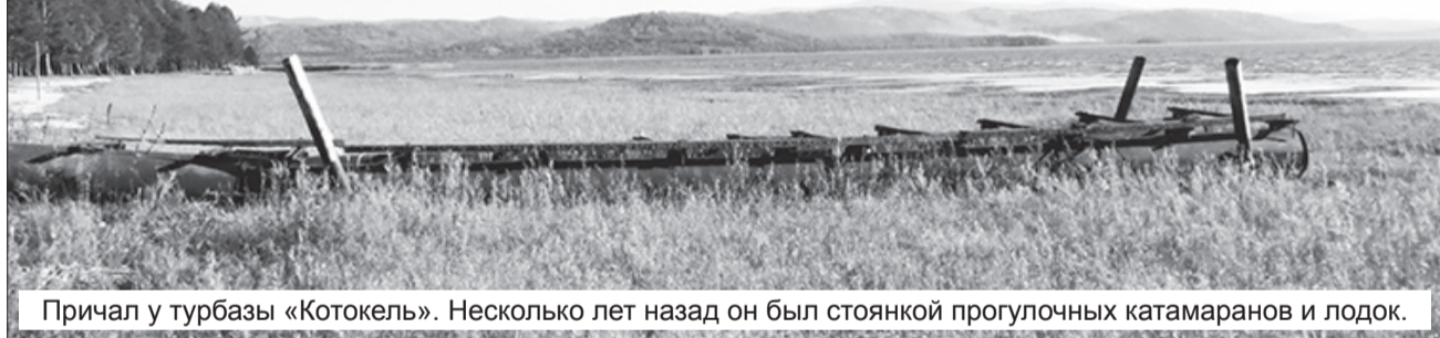
Причал у турбазы «Котокель». Несколько лет назад он был стоянкой прогулочных катамаранов и лодок.

Экосистемы малых водоемов не справляются с их интенсивной эксплуатацией