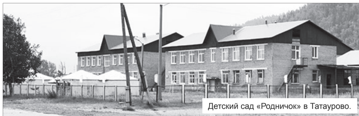
Детский сад «Родничок» в Татаурово.