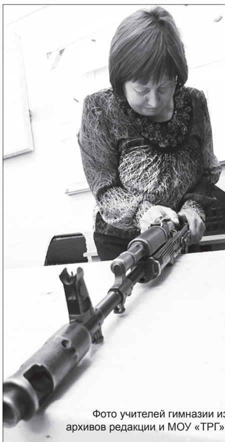
Фото учителей гимназии из архивов редакции и МОУ «ТРГ».

Чем измеряется труд и признание учителя? Наградями, средним баллом успеваемости? Стажем и категорией, победами в профессиональных конкурсах? Об этом всегда говорят в юбилейных речах, отчётных и праздничных докладах. Бесспорно, это важные показатели, они, конечно же, характеризуют профессиональный уровень учителя. А, может быть, признание учителя можно измерить каждодневными хлопотами, усталостью, количеством проверенных тетрадей, успехами учеников, благодарными словами родителей, письмами и звонками твоих подопечных? Высшая оценка, скорее, последнее, когда твои ученики тебя не забывают.