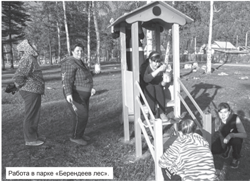
Работа в парке «Берендеев лес».

Мы надеемся, что в результате этого на экотропе «В Турке у Байкала» и в парке «Берендеев лес» будет намного чище. И с дождевыми и тальными ве-