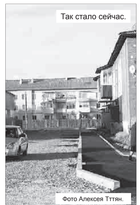
Так стало сейчас.