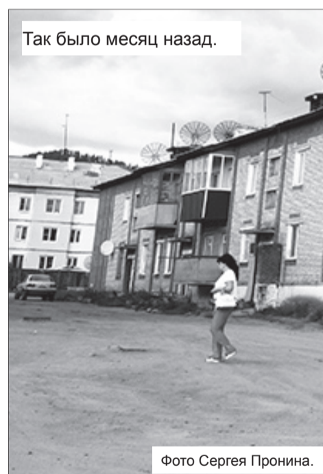
Так было месяц назад.