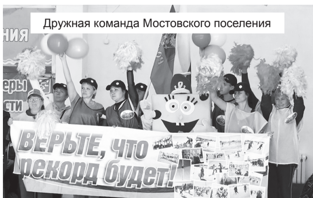
Дружная команда Мостовского поселения