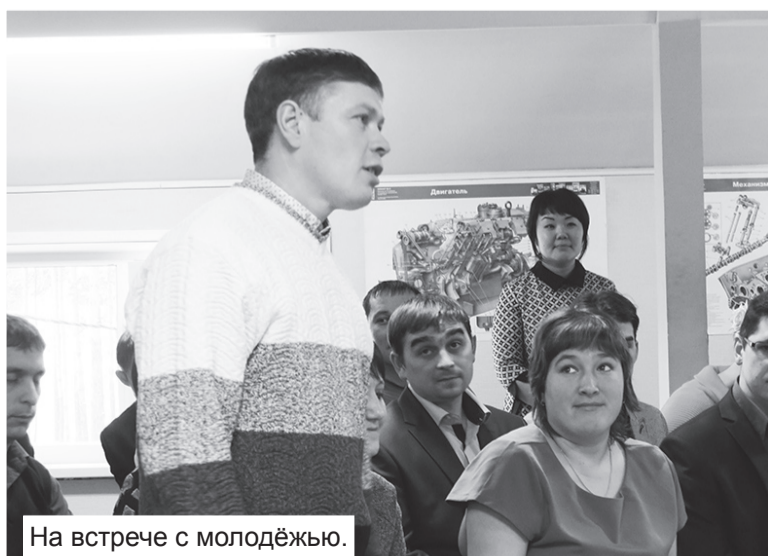
На встрече с молодежью.

Фельдшер скорой помощи Прибайкальской ЦРБ: «Появится ли в нашем районе реанимобиль?»