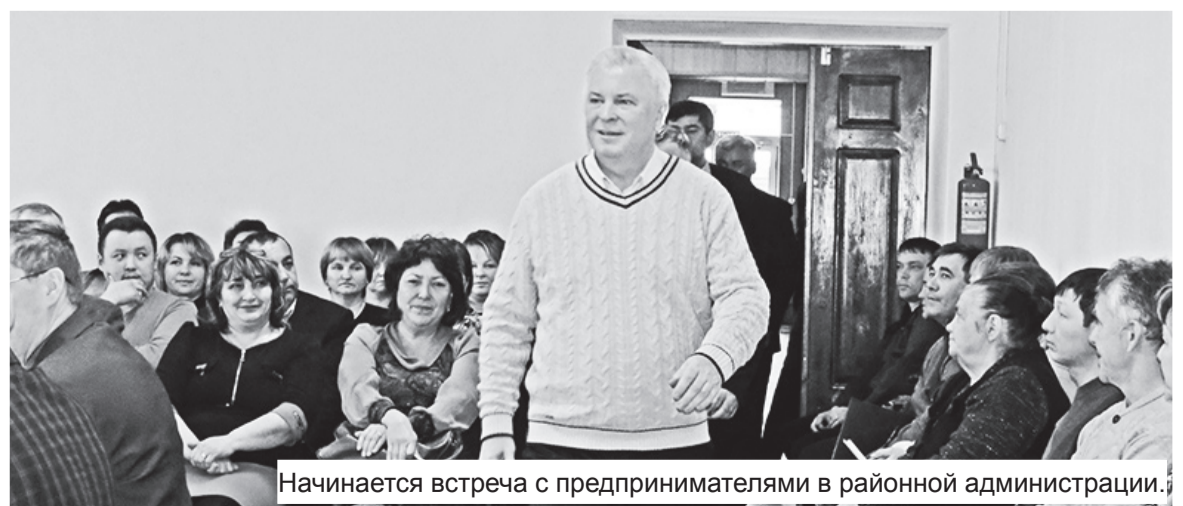
Начинается встреча с предпринимателями в районной администрации.