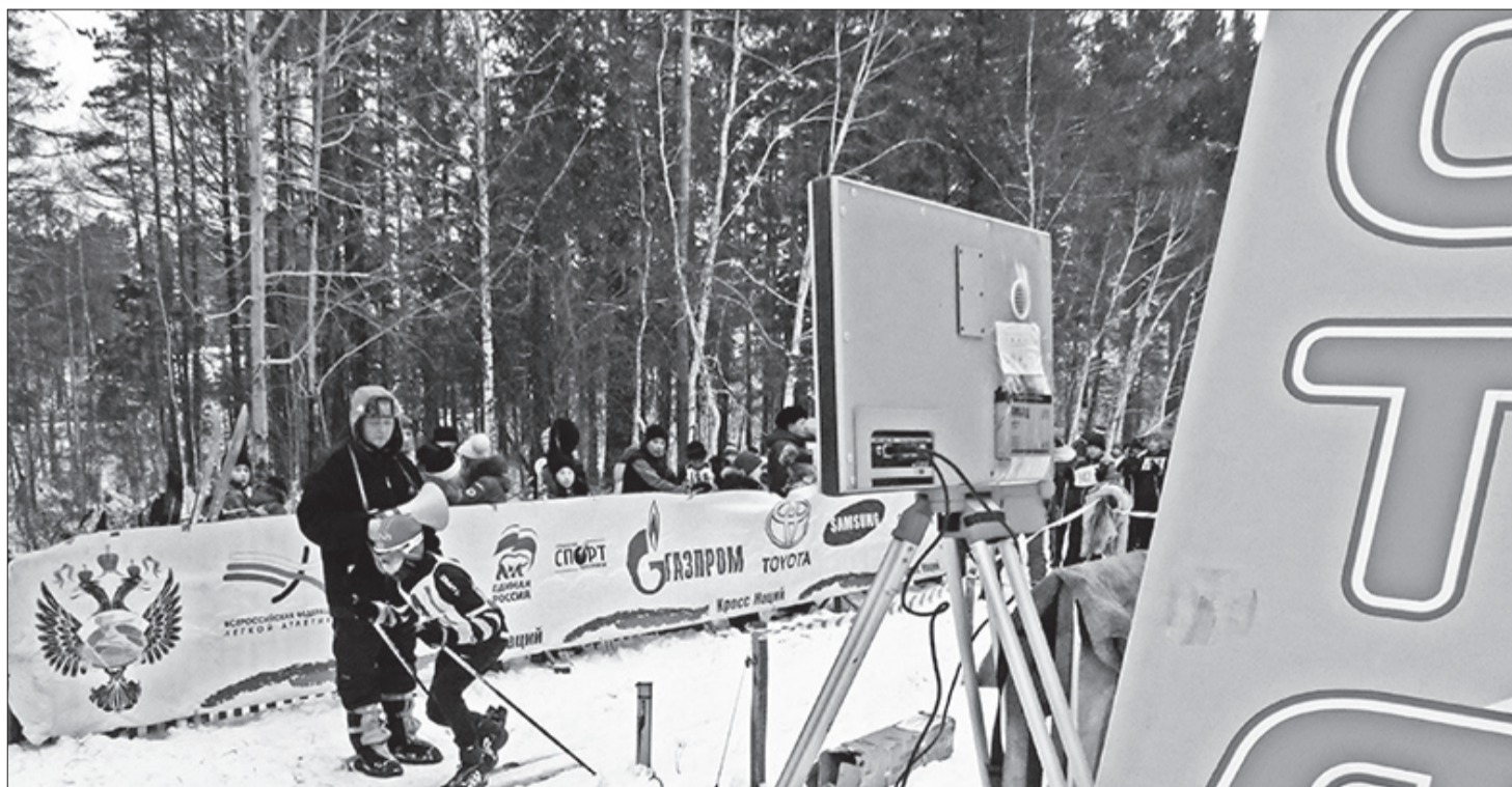
Электронное око внимательно следит за стартом и финишем каждого участника.

5 декабря 2015 г. в г. Кяхта проходил V республиканский турнир по гиревому спорту среди школьников и учащихся средних специальных учебных заведений, посвящённый памяти ветеранов педагогического труда, чемпионов России 50-х годов XX века Аносова П.И. и Кравцова Г.М.