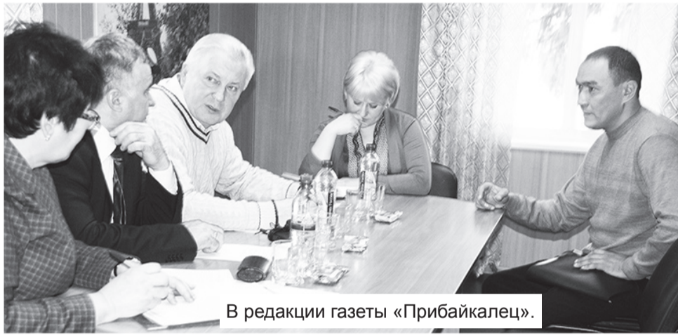
В редакции газеты «Прибайкалец».