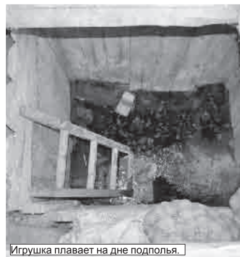
Игрушка плавает на дне подполья.