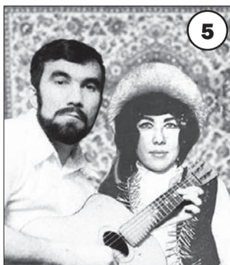
От В. Черневой, с. Кома.