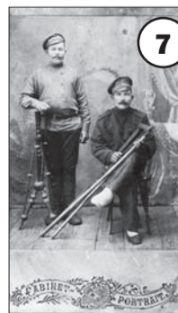
От ТОСа «Надежда», с. Гурулёво.