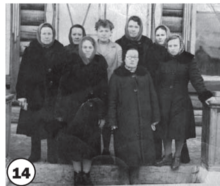
От А.М. Жаркой, с. Турунтаево.