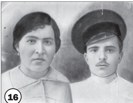
От О. Патрушевой, с. Иркилик.