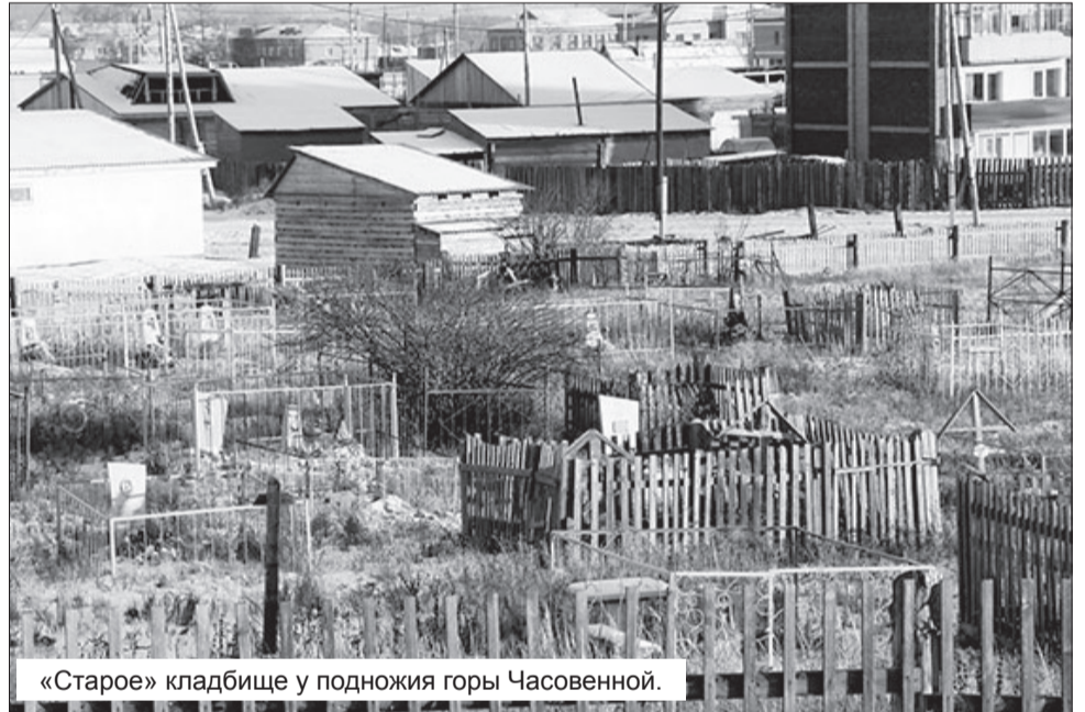
«Старое» кладбище у подножия горы Часовенной.