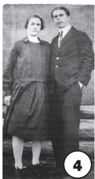
От И. Петрова, с. Гремячинск.

По данным ОМВД России по Прибайкальскому району.