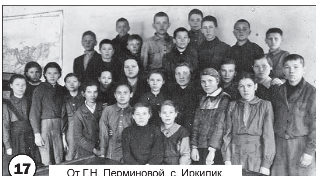
От Г.Н. Перминовой, с. Иркилик.