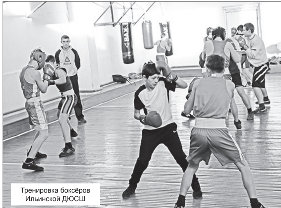
Тренировка боксёров Ильинской ДЮСШ

Удивились достижениям и обсудили проблемы