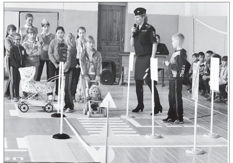
Дети пробовали себя даже в качестве мам на дорогах.

Анна ВЕРБИЦКАЯ-КОЛЕСНИКОВА, наш внешт. корр.