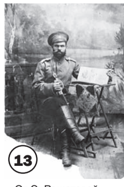
От Э. Решетовой, с. Турунтаево.