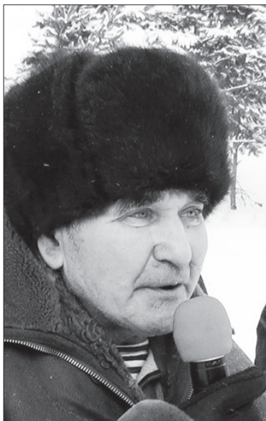
Напутствие мастера.