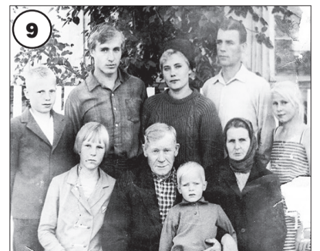
От М. Малыгина, с. Турунтаево.