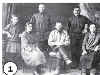
1 Далее будут только фамилии читателей, представивших фотографии из своих альбомов.

Итак, представляем конкурсантов в порядке публикации. В НОВОМ ГОДУ ЖДИТЕ НОВЫЕ КОНКУРСЫ. ЧИТАЙТЕ «ПРИБАЙКАЛЕЦ», УЧАСТВУЙТЕ. ПОБЕДИТЕЛЕЙ, КАК ВСЕГДА, ЖДУТ ПРИЗЫ.