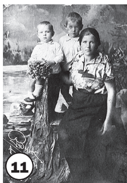
От В.В. Лапиной.