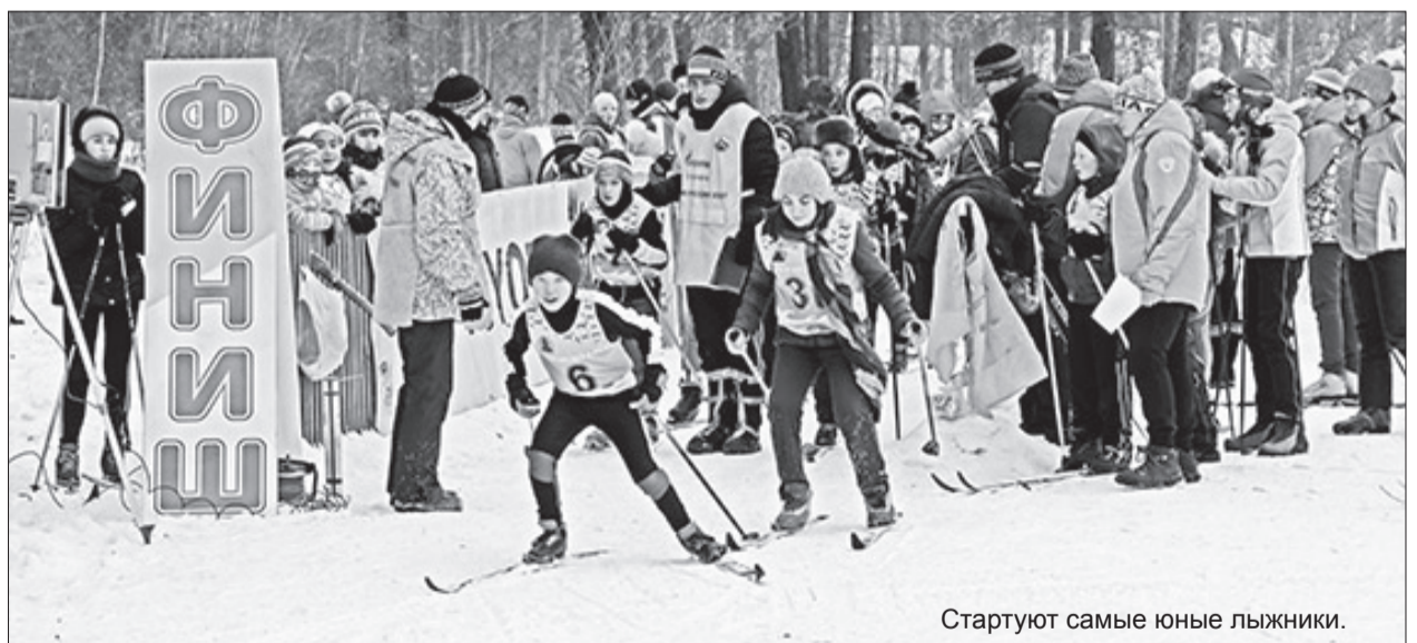
Стартуют самые юные лыжники.

Назвать начало зимы снежным, язык не повернется, поэтому старт был перенесен с Белой горы на лед Итанца. Стоит отметить хорошую подготовку трассы, лыжня широкая, плотная - за что спасибо тренеру-преподавателю Турун-