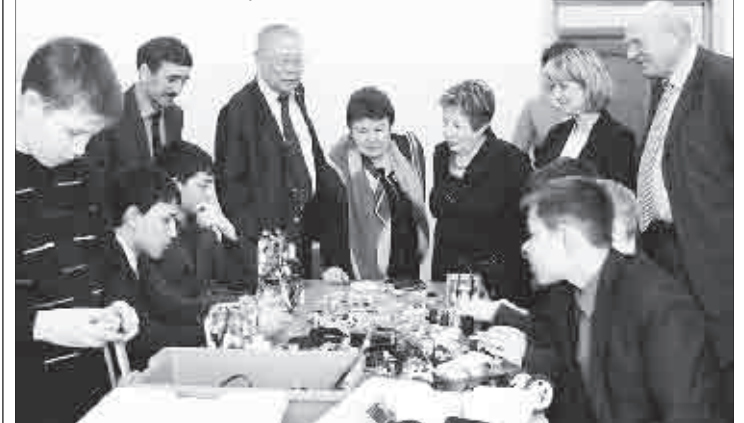
В Доме детского творчества.