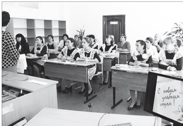
Классный час у выпускников Туркинской школы.