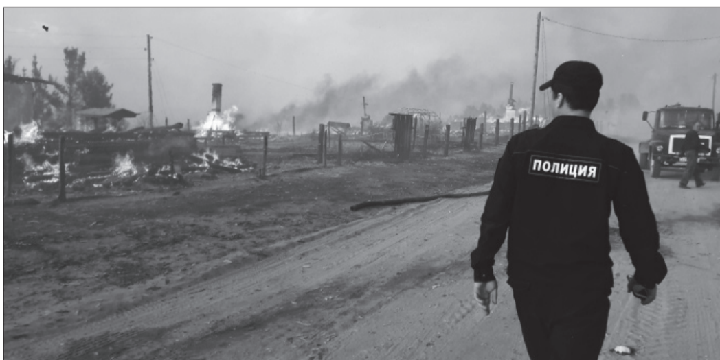
Полицейские будни. Всегда на переднем крае.