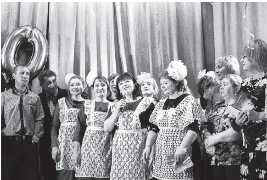
Вспоминая школьные годы.

За 90 лет Старо-Татауровскую школу окончили более двух тысяч человек