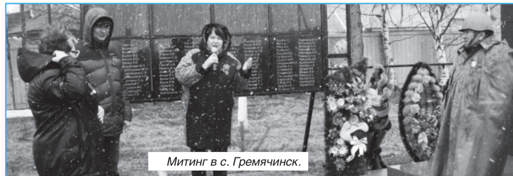
Митинг в с. Гремячинск.