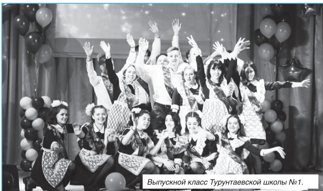
Выпускной класс Турунтаевской школы №1.

Последний звонок прозвучал для 117 выпускников 11-х классов и для 343 девятиклассников Прибайкальского района