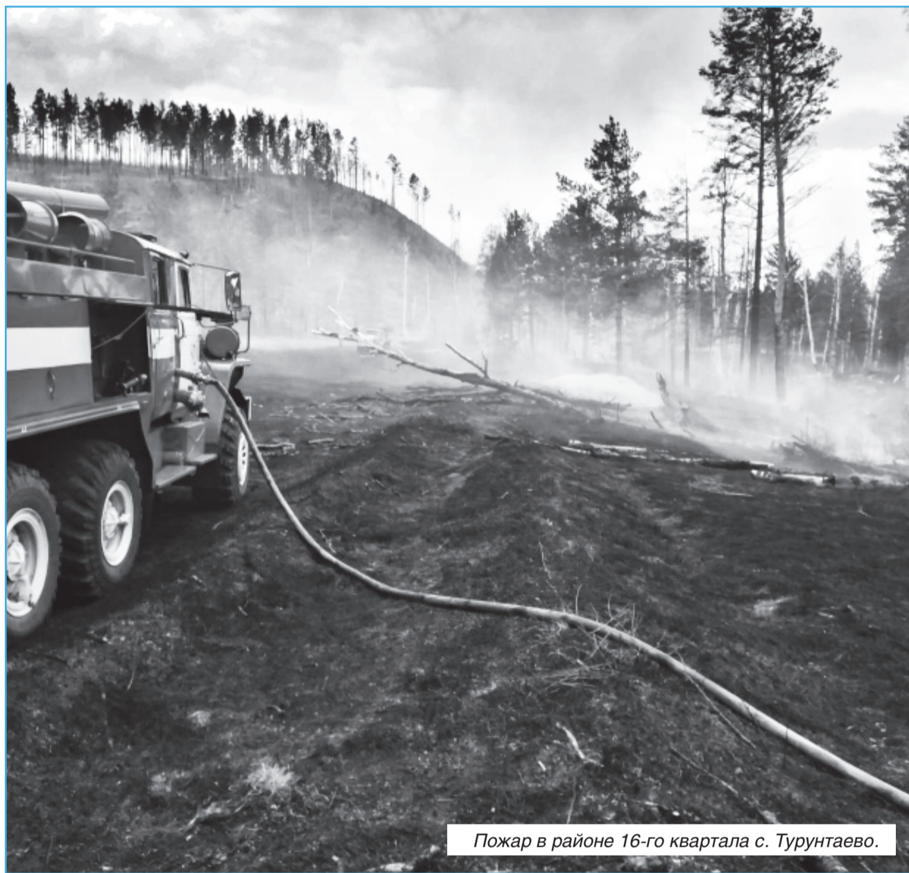
Пожар в районе 16-го квартала с. Турунтаево.

На территории Прибайкальского района введен особый противопожарный режим, который предусматривает ограничение въезда в лес, запрещает разжигание костров в лесах и населенных пунктах, выжигание сухой травы, сжигание мусора и других горючих материалов.