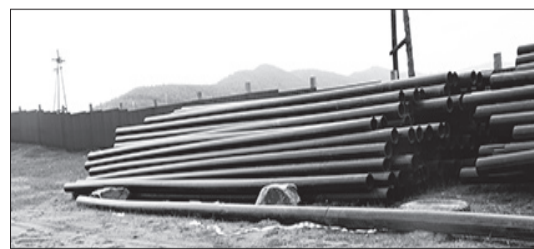
Трубы для водовода ждут своего часа.

Проект «Чистая вода» – один из 11-ти национальных проектов в РФ. Проводится в рамках национального проекта «Экология». Как следует из названия, он направлен на обеспечение россиян водой, отвечающей всем установленным нормам и безопасности в употреблении. Преимущественно финансируется за счет федерального бюджета.