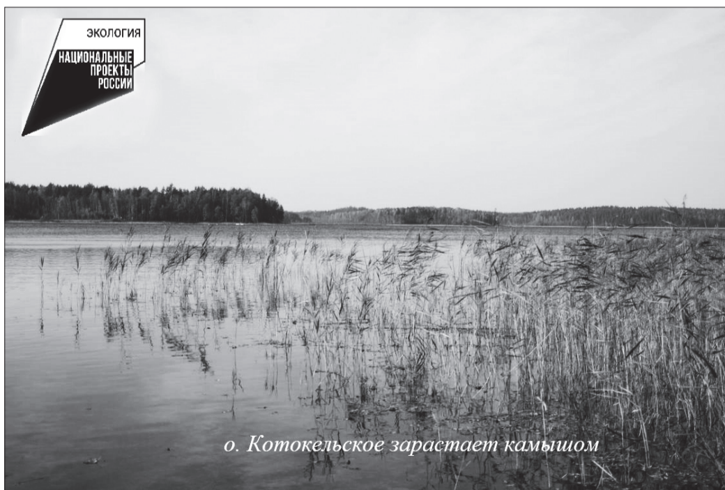
о. Котокельское зарастает камышом

В настоящее время происходит заболачивание озера, нарушается экологический