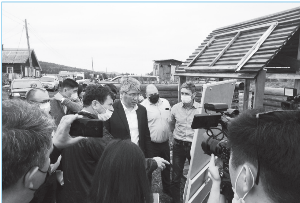
Обсуждается ситуация в селе Исток.