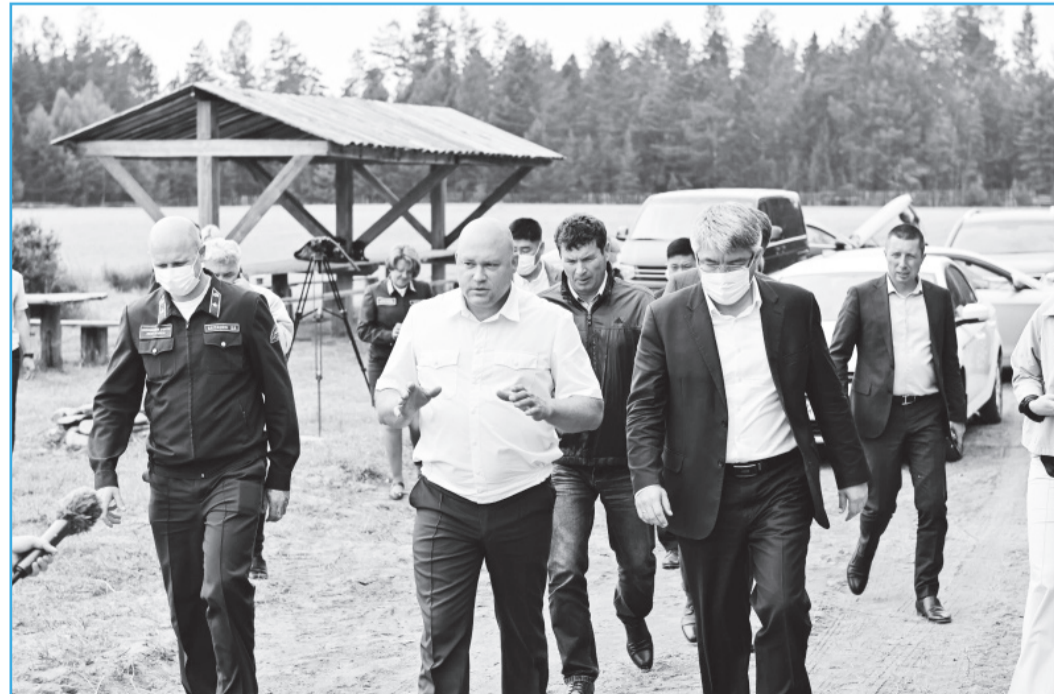
В Кикинском лесопитомнике.