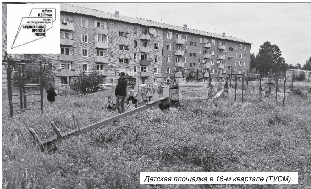
Детская площадка в 16-м квартале (ТУСМ).