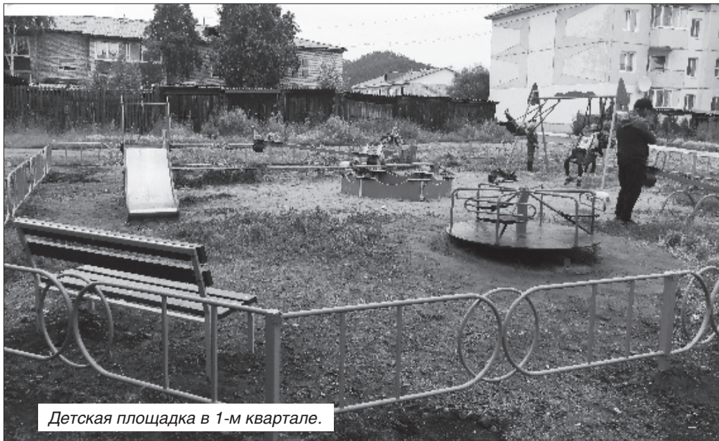
Детская площадка в 1-м квартале.