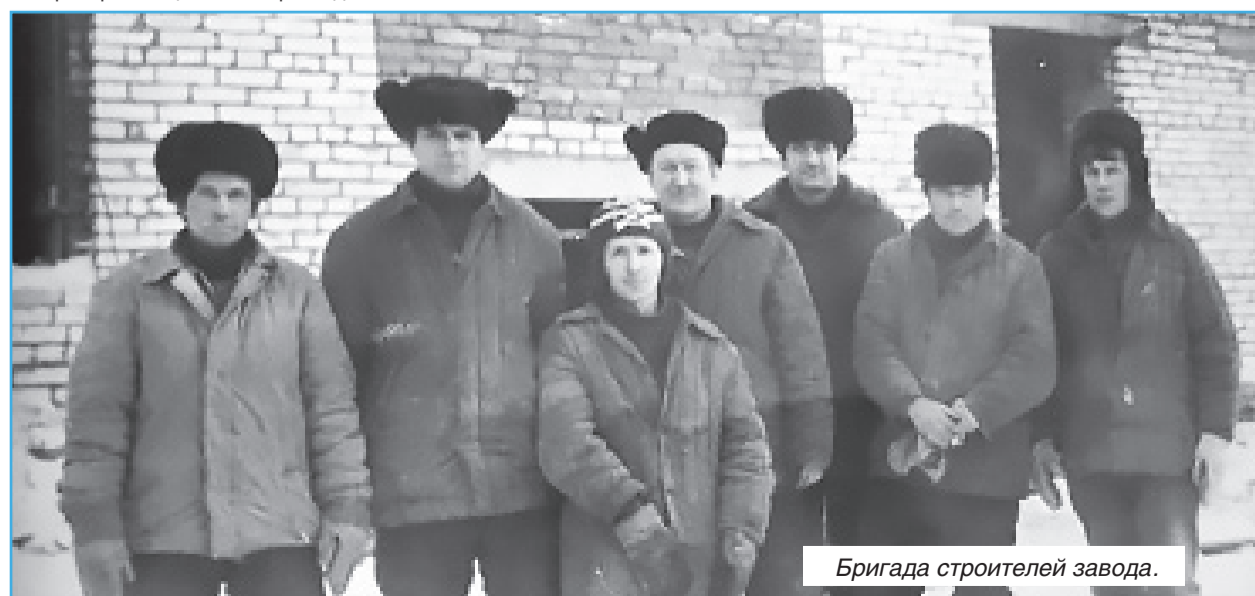
Бригада строителей завода.