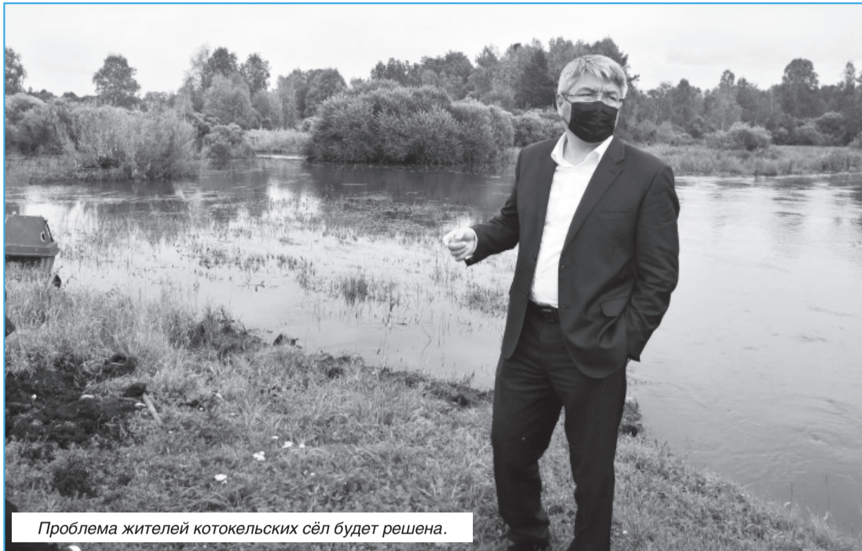
Проблема жителей котокельских сёл будет решена.

У большинства баз и домов отдыха площадь земельного участка не позволяет разместить полноценный водозабор. Отсутствие водозабора или иного источника водоснабжения является основанием для прекращения работы туристических объектов надзорными органами. После строительства водоводов это препятствие будет снято. Напомним, что строящийся водовод села Турка будет запитан водой от водозаборных сооружений ОЭЗ ТРТ «Байкальская гавань».